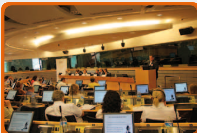
Záró konferencia Brüsszelben

A projekt zárásaként egy megvalósíthatóság tanulmány keretében kerültek összegzésre a projekt eredményei, mely tartalmazta a kérdőívek elemzésének tanulságait, a jó gyakorlat csere tapasztalatait, valamint elkészült egy, a projekt összes nemzetközi jó gyakorlatát bemutató kézikönyv.