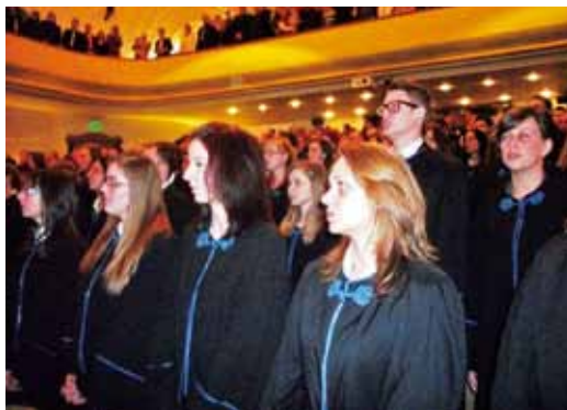
Az ünnepségen 111 fiatal tett szakmai hűségfogadalmat