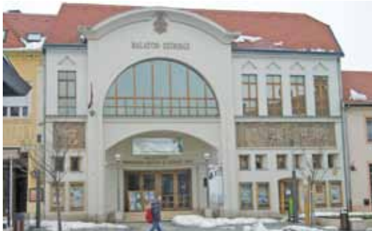
Tavaly 10 éves lett a Balaton Színház