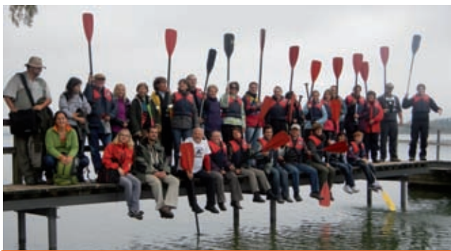
A Bódeni-tavi kenutúrán résztvevők csoportja

A Balatoni Civil Szervezetek Szövetsége (BCSzSz) Gyenesdiáson tartotta meg a „Tanulás a tavakért” Leonardo projekt németországi találkozójáról szóló beszámolóját.