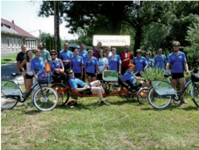
A PaNaTOUR résztvevői a túra végállomásán, Kerkaszentkirályon

pultjai látványos PaNaNet sarkot alkottak. Azóta számos más helyszínen (Kerkaszentkirály, Molnári, Letenye, Sarród, Eisenstadt, Lenti) nyilvánosságot kapott az installáció. A projektpartnerek szándéka, hogy a projektidőszak hátralévő részében és azt követően is minél több helyre eljusson az „utazó kiállítás”.