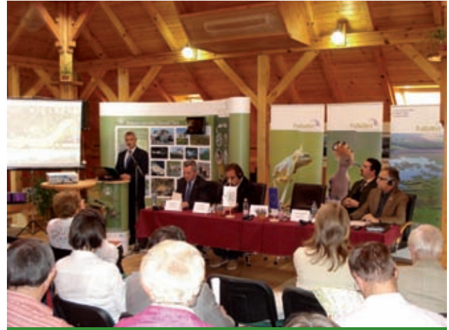
PaNaNet konferencia Lentiben

a határon átnyúló program által támogatott további ökoturisztikai fejlesztésekbe is.