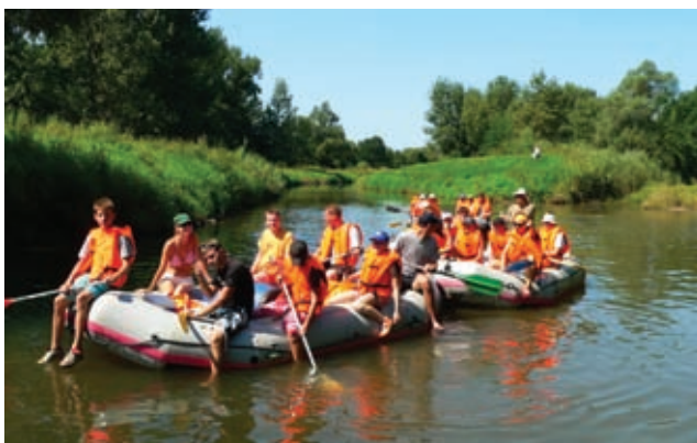
Csónaktúra a Murán

A projekt számos rendezvénye közül az egyik legkülönlegesebb a 2012. június 25-30. között megvalósított határon átnyúló PaNaTOUR promóciós kerékpártúra volt, amely evezéssel indult a Lajtától és kerékpározással folytatódott a Muráig. A PaNaTOUR 6 napja során mintegy 350 kilométert tettek meg a résztvevők az osztrák-magyar határtérségben. Gyönyörű tájakon kerékpározva megismerhették a nemzeti- és natúrparkok látványait, izgalmas programkínálatát, illetve betekintést nyerhettek