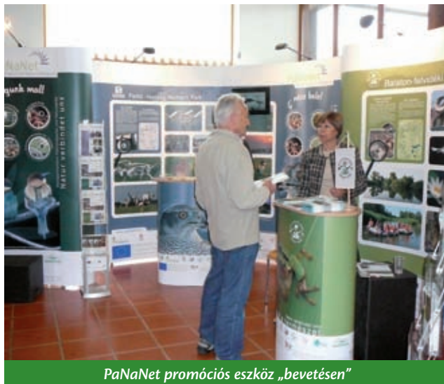
PaNaNet promóciós eszköz „bevetésen”

A PaNaNet projektet és annak védett területeit bemutató promóciós eszköz a nagyközönség számára első alkalommal 2012. április 20-án Illmitzben, a BirdExperience rendezvényen mutatták be, ahol a projektpartnerek egymás mellett felállított paravánjai, információs