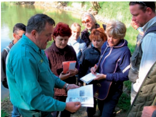
PaNaNet akkreditált természetvédelmi túravezető képzés, terepi gyakorlat

A projekt során a résztvevő partnerek közös PaNaNet arculati elemeket dolgoztak ki, létrejött a közös honlap ( www.pananet.eu ), elkészült a teljes PaNaNet régiót ábrázoló turistatérkép , valamint több információs és ismeretterjesztő kiadvány. A számos gyönyörű fotóval és grafikával illusztrált PaNaNet könyv az egyedülálló együttműködés üzenetét hordozza, de egyben a tájegységek közötti különbözőségeket is megjelenti.