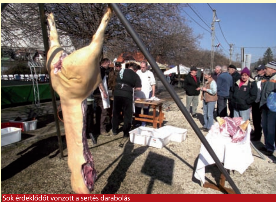
Sok érdeklődőt vonzott a sertés darabolás