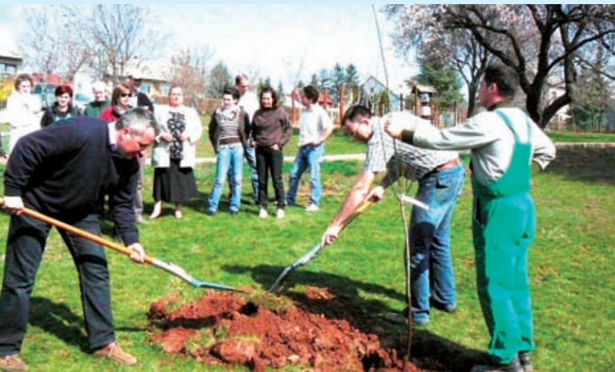
Gyümölcsfa ültetés Csapokon

E jelszóval országos mozgalom indult az őshonos gyümölcsfáink megőrzéséért: Zala és Vas megyei civilek felhívására több magyarországi településen ültettek ritka gyümölcsfákat Gyümölcsoltó Boldogasszony napján, március 25-én. A kezdeményezést a Vidékfejlesztési Minisztérium (VM) is támogatta, hiszen valamennyiünk érdeke, hogy a Kárpát-medencében régóta termesztett gyümölcsfajták, illetve tájfajták fennmaradjanak, újrarahonosodjanak.