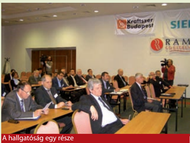
A hallgatóság egy része