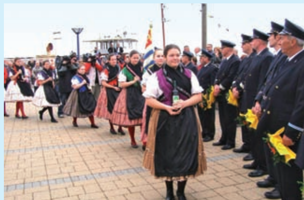
Néptáncosok kedveskedtek a hajósoknak

A Balaton egy egységes egész; lehet és kell is településenként nézni, de igazából együtt ér valamit – mondta az első hajó érkezését követően tartott ünnepségen Siófok polgármestere, Balázs Árpád.