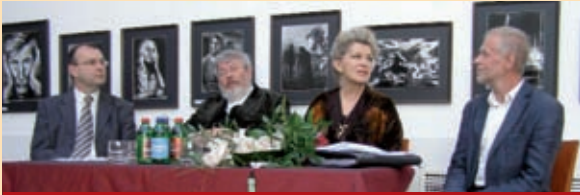
A sajtótájékoztató vendégei

Szeptemberben immáron huszadik alkalommal rendez meg Balatonfüred önkormányzata, illetve annak alapítványa a Salvatore Quasimodo Költőversenyt.