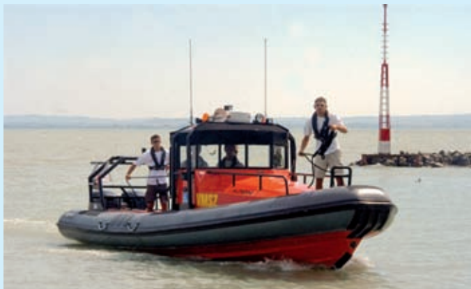
A Rupert mentőhajó

Tapasztalataik szerint a vitorlázók jobban ügyeltek a balesetek megelőzésére, így - a Kék Szalag vitorlásverseny kivételével, amikor 233 embert mentettek ki a civil vízi mentők - kevesebb mentésre volt szükség a vízben, miközben a korábbi években több esetben kellett beavatkozni a strand mentőszolgálatnak. Az idén 36 balatoni strandon szolgálatot adó VMSZ 1010 esetben végzett strandi ellátást, amelyekből 57 bizonyult súlyosnak. A Rupert sürgősségi mentőhajót 23 esetben az Országos Mentőszolgálat felkérésére vetették be. Ezt elsősorban annak köszönhették, hogy a Belügyminisztériumtól nyár elején megérkezett a 15 millió forintos gyorssegély, s így időben kezdhettem meg munkáját a Balatonon az egyetlen sürgősségi mentőhajó. A harmadik éve bizonyító Rupert mellé egyébként további három