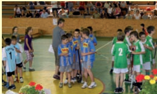
Fonyód - II. Kistérségi Egészségnap