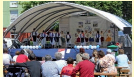
Balatonlelle - VI. Kistérségi Nap Fesztivál

A Fonyód Kistérség Többcélú Társulása 2009-es év őszén „Közösen, egészségesen a Nap alatt” címmel pályázatot nyújtott be Dél-Balaton Leader Vidékfejlesztési Nonprofit Zrt. által Rendezvényszervezés, valamint marketing tevékenység célterületen meghirdetett pályázati felhívására.