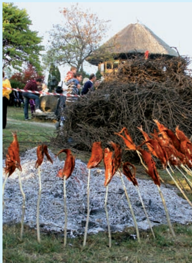
Parázs fölött a garda

Az idei fesztivál is látványhalással vette kezdetét. A garda egykor a Balaton egyik legjellegzetesebb halának számított, amely ősszel (amikorra a tó leve lehűl) csapatokba, rajokba verődve mozog. A tihanyi halászok akkor kezdték meg a gardahalászatot, amikor az úgynevezett „látó ember” a félsziget magaslatairól figyelve meglátta a felszínhez közel úszó, ezüstösen csillogó halrajokat. Ő irányította kezdetleges (ám bevált) kommunikációs eszközökkel a hálót húzó halászokat, akik aztán a hal révén kenyeret biztosítottak családjuknak. Ezt a szokást elevenítette fel az utókor, s a farsztó, olykor veszéyes munkát tette látványvá, turiszticalogatóvá. A szokások része a hal sütése is, melyet kizárólag szőlővessző parazsa felett lehet végezni, s a paprikás lisztben megforgatott gardát is csak akkor lehet megsütni, ha már hetvenkétszer beirdalták! Néhányan még ma is élnek az öreg