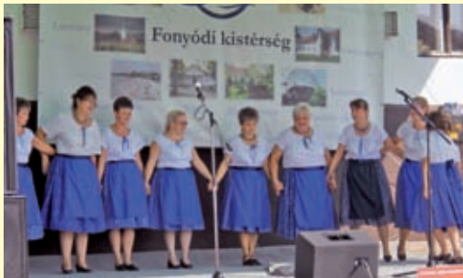
Gamás - VII. Kistérségi Nap Fesztivál