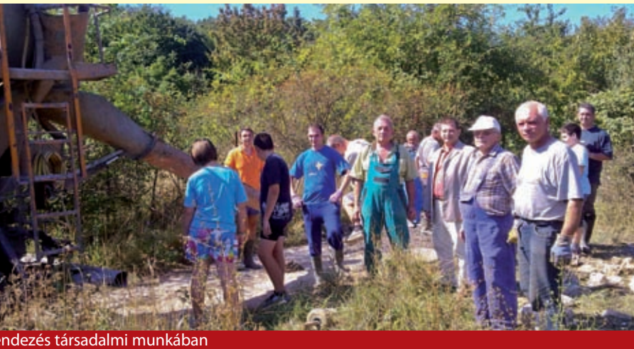
ndezés társadalmi munkában

Alsóörs 30 kilométeres közúthálózata nem kevés gondot okoz mind az önkormányzatnak, mind az érintett lakó- és üdülőingatlan tulajdonosoknak. Számos helyen korábban csak ideiglenes, járművel meglehetősen óvatosan használható utakat alakítottak ki, amelyeken hiányzik a járda és a csapadékvíz elvezetés is.