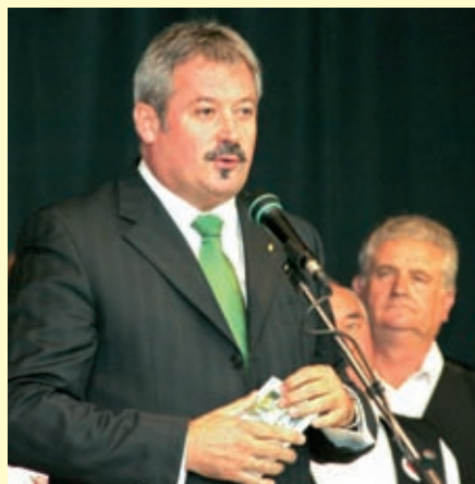
V. Németh Zsolt államtitkár

Hebling Zsolt köszöntőjét követően V. Németh Zsolt államtitkár mondta el avató beszédét. Hangsúlyozta, bár a negyven éves épület nem volt lepusztult állapotban, de már nem tudta kiszolgálni a 21. század igényeit.